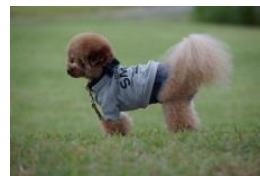
稀月くん / 受診回数 5回 トイ・プードル / 5歳 / 1.7kg